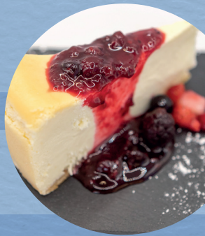
Cheesecake / 6,00€