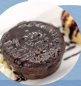
Coulant de xocolata / 6,00€