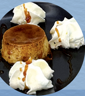
Flam d'ou amb nata / 4,50€