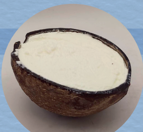
Coco gelat / 4,50€