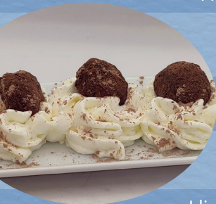
Trufes de xocolata / 4,50€