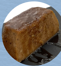
Puding casolà / 4,50€